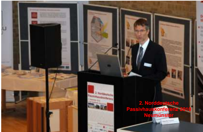
2. Norddeutsche Passivhauskonferenz 2010 Neumünster

EFFIZIENTE GEBÄUDE 2016 8. NORDDEUTSCHE PASSIVHAUSKONFERENZ