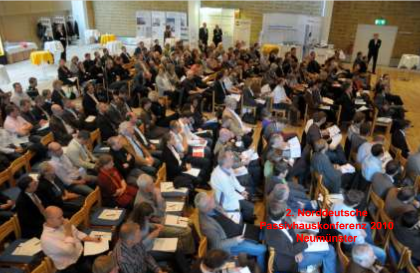
2. Norddeutsche Passivhauskonferenz 2010 Neumünster