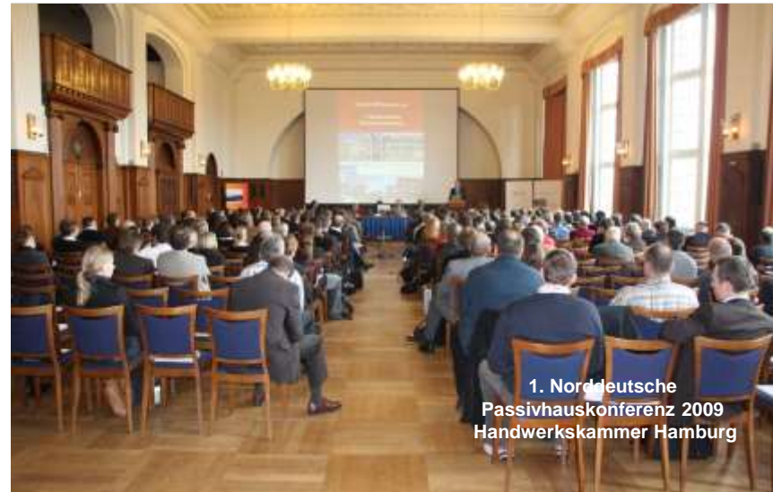
1. Norddeutsche Passivhauskonferenz 2009 Handwerkskammer Hamburg