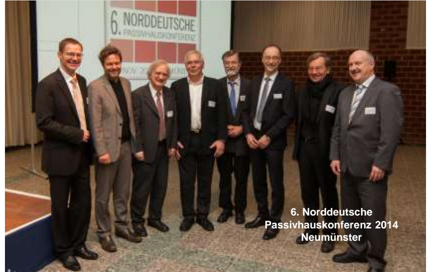
6. Norddeutsche Passivhauskonferenz 2014 Neumünster