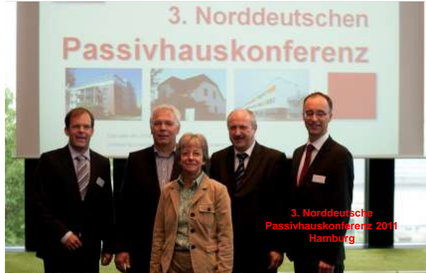
3. Norddeutsche Passivhauskonferenz 2011 Hamburg