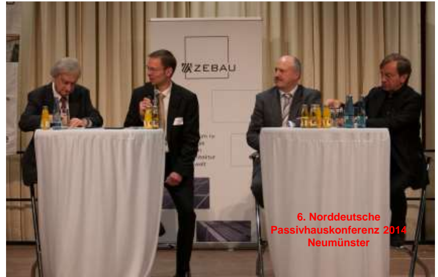
6. Norddeutsche Passivhauskonferenz 2014 Neumünster