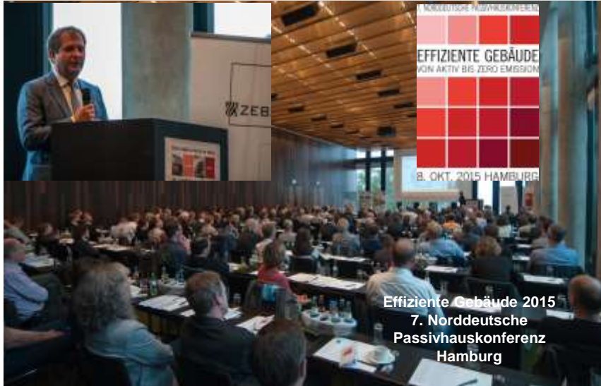
Effiziente Gebäude 2015 7. Norddeutsche Passivhauskonferenz Hamburg