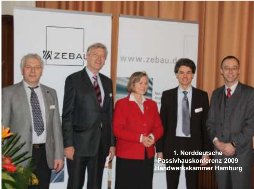
1. Norddeutsche Passivhauskonferenz 2009 Handwerkskammer Hamburg