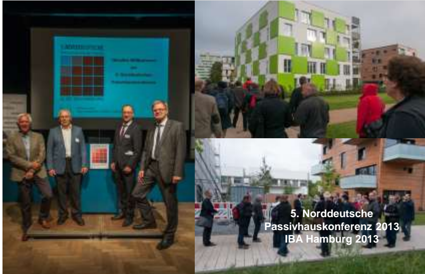
5. Norddeutsche Passivhauskonferenz 2013 IBA Hamburg 2013