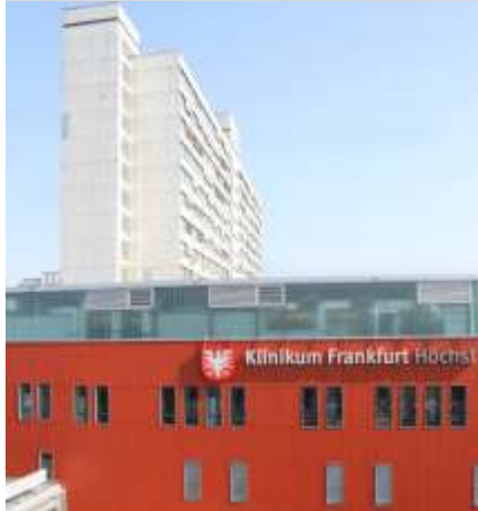
Klinikum Frankfurt-Höchst