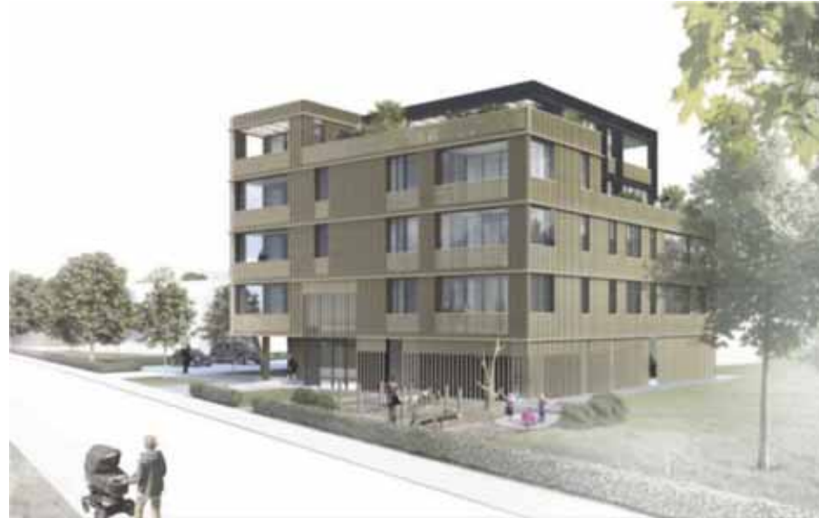
Geschosswohnungsbau im Fischbeker Heidbrook (Architekten: Thauer Lüdtker Höffgen Architekten)