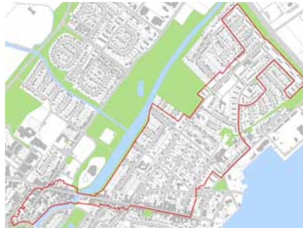
Projektgebiet Koogstraße / Beamtenviertel Brunsbüttel