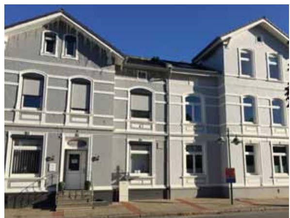
Wohn-/Gewerbehäuser der Koogstraße

➡ Melden Sie sich unter: brunsbuettel@zebau.de .