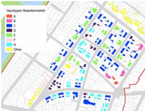
Gebäudetypen im Beamtenviertel