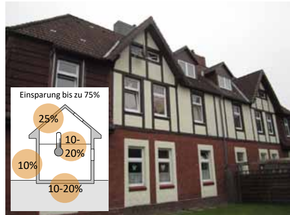
Denkmalgeschützte Gebäude im Beamtenviertel

Insgesamt lässt sich der Energiebedarf um bis zu 75 % reduzieren, die konkreten Potenziale müssen aber im Einzelfall nach Untersuchung der Bausubstanz festgelegt werden.